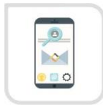
通过账号和手机验证码 重置密码