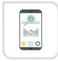
通过账号和手机验证码 重置密码