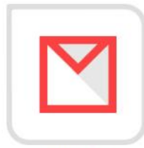
通过账号和邮箱 重置密码